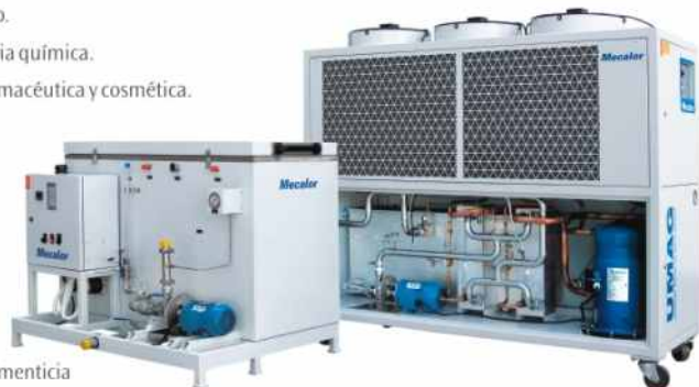
Solución para la Industria Alimenticia