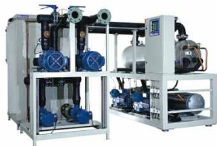
Central de Agua Helada