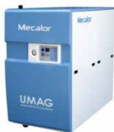
Chiller modelo MSW