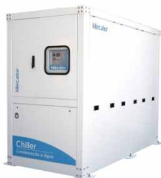
Chiller modelo RLW