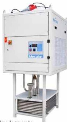
Chiller de Imersão